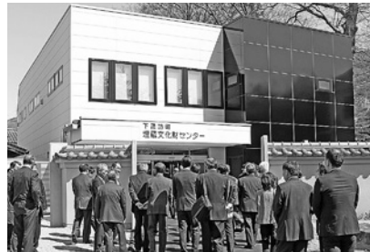
埋蔵文化財センター改修事業