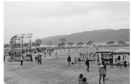
赤砂崎公園整備事業